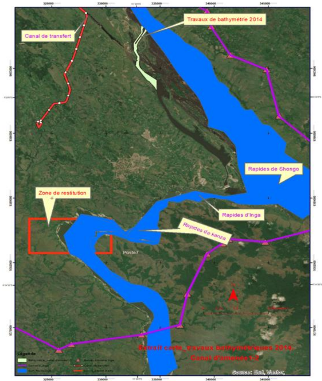
Figure 2: Extrait d'une carte bathymétrique partielle (levés antérieurs de 2014). Ce document illustre le caractère incomplet des levés réalisés avant la présente étude : seules certaines sections du fleuve à Inga avaient été sondées, laissant des zones stratégiques non couvertes (notamment vers Kianda en amont et Bundi en aval). La couverture bathymétrique limitée visible sur cette carte justifie la nécessité de réaliser un levé exhaustif dans le cadre de la mission actuelle.